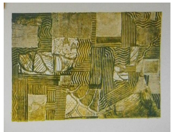
Za návštěvníky z 2. stupně ZŠ BH Olga Gruhnová